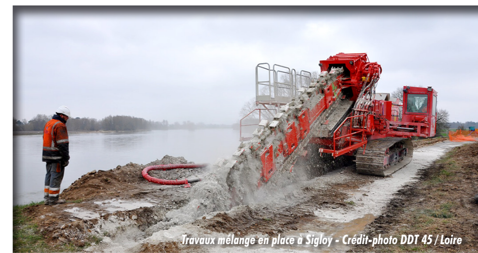
Travaux mélange en place à Sigloy

Ce programme pourra être adapté en fonction des conclusions de l'étude des vals du giennois en cours de réalisation ■